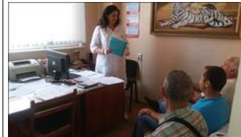
Школа отцов организованы и проведены занятия Школы отцов