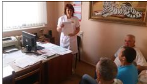
Школа отцов организованы и проведены занятия Школы отцов

Мероприятие: Проведено 4 занятия школы отцов для 5 отцов. В рамках работы волонтерского движения "Больничные клоуны" проведено не менее 10 волонтерами 8 мероприятий в стационаре для не менее 30 семей с ОВЗ.