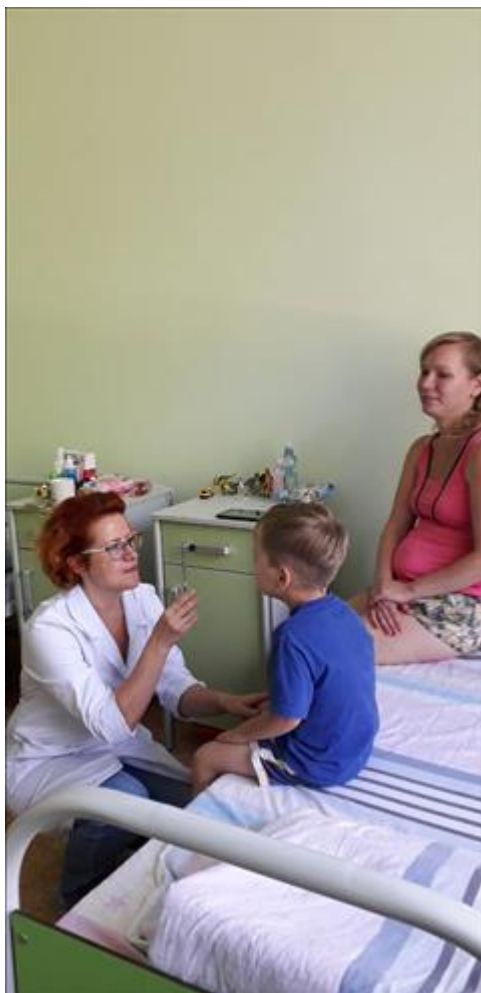
Реабилитационные услуги Оказано реабилитационных услуг матерям и детям специалистами службы медицинского сопровождения детей- инвалидов