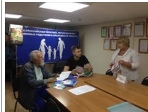
Школа отцов организованы и проведены занятия Школы отцов