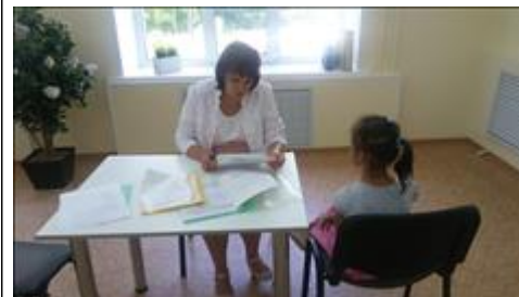
консультация семей с детьми Оказание социально-психологических и юридических услуг матерям и детям тремя специалистами службы социально-психологической помощи семьям с детьми с ОВЗ.