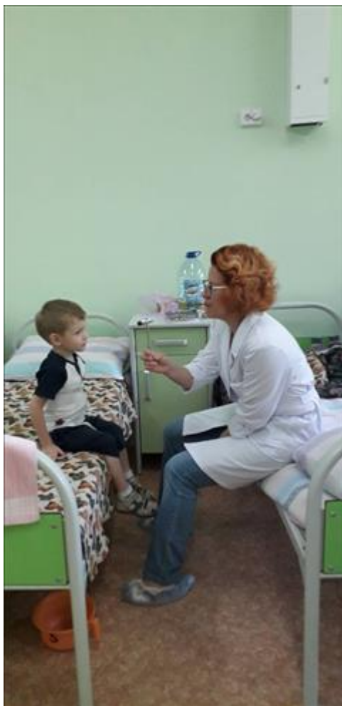
Реабилитационные услуги Оказано реабилитационных услуг матерям и детям специалистами службы медицинского сопровождения детей- инвалидов.