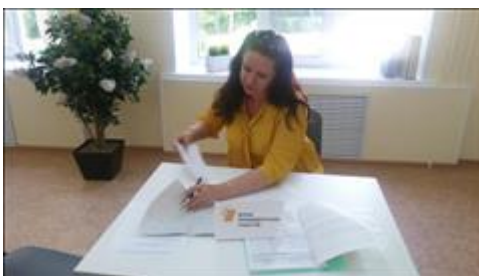
консультация семей с детьми Оказание социально-психологических и юридических услуг матерям и детям тремя специалистами службы социально-психологической помощи семьям с детьми с ОВЗ.