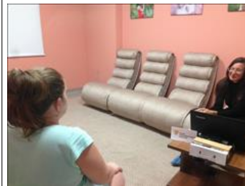
консультация семей с детьми Оказание социально-психологических и юридических услуг матерям и детям тремя специалистами службы социально- психологической помощи семьям с детьми с ОВЗ