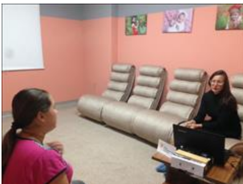
консультация семей с детьми Оказание социально-психологических и юридических услуг