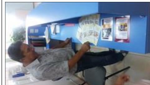
Школа отцов организованы и проведены занятия Школы отцов