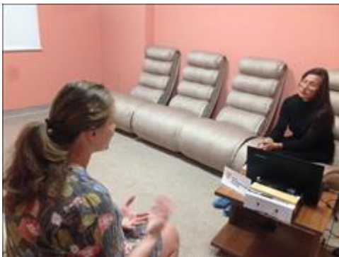
консультация семей с детьми Оказание социально-психологических и юридических услуг матерям и детям тремя специалистами службы социально-психологической помощи семьям с детьми с ОВЗ.