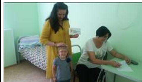
консультация семей с детьми Оказание социально-психологических и юридических услуг матерям и детям тремя специалистами службы социально-психологической помощи семьям с детьми с ОВЗ.